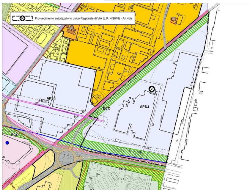
Estratto PSC del Comune di Sassuolo - Variante